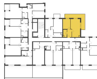
Schéma půdorysu představuje dispoziční řešení bytu. Zobrazené vybavení nábytkem, vestavěné skříně, kuchyňská linka včetně spotřebičů a pračky nejsou součástí dodávky bytu. Toto vybavení je zobrazeno pouze pro názornost. Celková podlahová plocha je vypočtena dle nařízení vlády č. 366/2013 Sb. Veškeré informace jakkoliv publikované v tomto dokumentu jsou nezávazné marketingové informace obecné povahy, které nelze vykládat jako nabídku na uzavření smlouvy ani se jich nelze dovolávat.

+420 226 292 876 info@homeportal.cz www.homeportal.cz