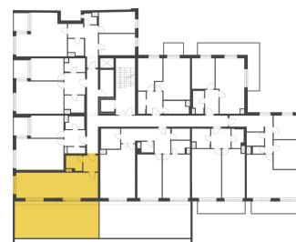
Schéma půdorysu představuje dispoziční řešení bytu. Zobrazené vybavení nábytkem, vestavěné skříně, kuchyňská linka včetně spotřebičů a pračky nejsou součástí dodávky bytu. Toto vybavení je zobrazeno pouze pro názornost. Celková podlahová plocha je vypočtena dle nařízení vlády č. 366/2013 Sb. Veškeré informace jakkoliv publikované v tomto dokumentu jsou nezávazné marketingové informace obecné povahy, které nelze vykládat jako nabídku na uzavření smlouvy ani se jich nelze dovolávat.

+420 226 292 876 info@homeportal.cz www.homeportal.cz