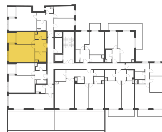
Schéma půdorysu představuje dispoziční řešení bytu. Zobrazené vybavení nábytkem, vestavěné skříně, kuchyňská linka včetně spotřebičů a pračky nejsou součástí dodávky bytu. Toto vybavení je zobrazeno pouze pro názornost. Celková podlahová plocha je vypočtena dle nařízení vlády č. 366/2013 Sb. Veškeré informace jakkoliv publikované v tomto dokumentu jsou nezávazné marketingové informace obecné povahy, které nelze vykládat jako nabídku na uzavření smlouvy ani se jich nelze dovolávat.

+420 226 292 876 info@homeportal.cz www.homeportal.cz