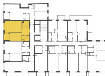
Schéma půdorysu představuje dispoziční řešení bytu. Zobrazené vybavení nábytkem, vestavěné skříně, kuchyňská linka včetně spotřebičů a pračky nejsou součástí dodávky bytu. Toto vybavení je zobrazeno pouze pro názornost. Celková podlahová plocha je vypočtena dle nařízení vlády č. 366/2013 Sb. Veškeré informace jakkoliv publikované v tomto dokumentu jsou nezávazné marketingové informace obecné povahy, které nelze vykládat jako nabídku na uzavření smlouvy ani se jich nelze dovolávat.

+420 226 292 876 info@homeportal.cz www.homeportal.cz