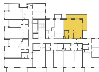
Schéma půdorysu představuje dispoziční řešení bytu. Zobrazené vybavení nábytkem, vestavěné skříně, kuchyňská linka včetně spotřebičů a pračky nejsou součástí dodávky bytu. Toto vybavení je zobrazeno pouze pro názornost. Celková podlahová plocha je vypočtena dle nařízení vlády č. 366/2013 Sb. Veškeré informace jakkoliv publikované v tomto dokumentu jsou nezávazné marketingové informace obecné povahy, které nelze vykládat jako nabídku na uzavření smlouvy ani se jich nelze dovolávat.

+420 226 292 876 info@homeportal.cz www.homeportal.cz