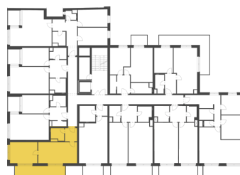
Schéma půdorysu představuje dispoziční řešení bytu. Zobrazené vybavení nábytkem, vestavěné skříně, kuchyňská linka včetně spotřebičů a pračky nejsou součástí dodávky bytu. Toto vybavení je zobrazeno pouze pro názornost. Celková podlahová plocha je vypočtena dle nařízení vlády č. 366/2013 Sb. Veškeré informace jakkoliv publikované v tomto dokumentu jsou nezávazné marketingové informace obecné povahy, které nelze vykládat jako nabídku na uzavření smlouvy ani se jich nelze dovolávat.

+420 226 292 876 info@homeportal.cz www.homeportal.cz