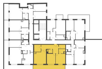
Schéma půdorysu představuje dispoziční řešení bytu. Zobrazené vybavení nábytkem, vestavěné skříně, kuchyňská linka včetně spotřebičů a pračky nejsou součástí dodávky bytu. Toto vybavení je zobrazeno pouze pro názornost. Celková podlahová plocha je vypočtena dle nařízení vlády č. 366/2013 Sb. Veškeré informace jakkoliv publikované v tomto dokumentu jsou nezávazné marketingové informace obecné povahy, které nelze vykládat jako nabídku na uzavření smlouvy ani se jich nelze dovolávat.

+420 226 292 876 info@homeportal.cz www.homeportal.cz