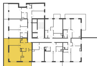
Schéma půdorysu představuje dispoziční řešení bytu. Zobrazené vybavení nábytkem, vestavěné skříně, kuchyňská linka včetně spotřebičů a pračky nejsou součástí dodávky bytu. Toto vybavení je zobrazeno pouze pro názornost. Celková podlahová plocha je vypočtena dle nařízení vlády č. 366/2013 Sb. Veškeré informace jakkoliv publikované v tomto dokumentu jsou nezávazné marketingové informace obecné povahy, které nelze vykládat jako nabídku na uzavření smlouvy ani se jich nelze dovolávat.

+420 226 292 876 info@homeportal.cz www.homeportal.cz