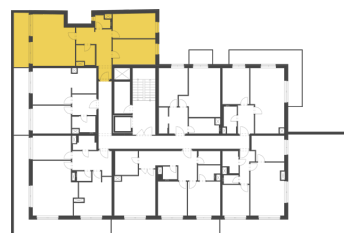
Schéma půdorysu představuje dispoziční řešení bytu. Zobrazené vybavení nábytkem, vestavěné skříně, kuchyňská linka včetně spotřebičů a pračky nejsou součástí dodávky bytu. Toto vybavení je zobrazeno pouze pro názornost. Celková podlahová plocha je vypočtena dle nařízení vlády č. 366/2013 Sb. Veškeré informace jakkoliv publikované v tomto dokumentu jsou nezávazné marketingové informace obecné povahy, které nelze vykládat jako nabídku na uzavření smlouvy ani se jich nelze dovolávat.

+420 226 292 876 info@homeportal.cz www.homeportal.cz